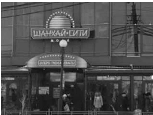
写真 3) ショッピングモール 「シャンハイ・シティ」

さて、中国人市場「上海」は、「イルクーツク市キーロフ地区公営商業所有複合体管理市行政機関 (Муниципальное учреждение по управлению муниципальными торговыми имущественными комплексами Кировского района города Иркутска)」といういかにも回りくどい公設名が正式名称としてついている。地代だけでも、イルクーツク市は莫大な収入を得てきた 8 。それでも、市当局が常に中国人市場への監視を強め、最後には閉鎖へと追い込んだ理由は、何であろうか。