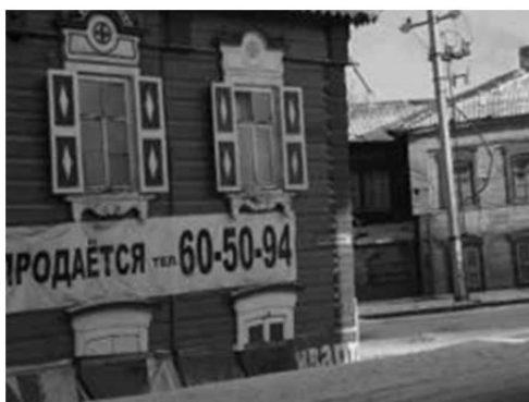
写真1) 売り出される中国人居住家屋

は、90年代から2003年までの拡大・発展のなかで、旧ソ連時代においては地元住民が遭遇しなかった外国人としての中国人が目立って存在感を示し、同時に中国製品が存在感を日常生活のなかで示していく様を経験している。当時、この中国人市場「上海」が中国人街的要素を持っていたことも事実である。2003年までの中国人市場は、製品と人の両面で「中国人」的性格の強いものであったし、実際に中国人部落ができあがるほど市場の周辺には市場で働く中国人が物件を購入し居住していた。市場では中国語新聞が発行され、いくつかの中国人社会団体が形成され集团的行動をとるなど、社会的実践を伴う中国人ディアスポラの形成が予感されていた。2003年以降の市場の縮小、2004年の市場廃止方針、2007年の外国人地位法改正により小売業店頭で外国人が労働できなくなったことなど、度重なる規制により、市場周辺に居住していた中国人も去り、かつての部落は借り手・買い手のいない廃墟の区画となっている（写真1）。