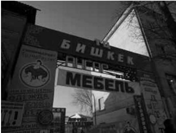
写真6) クルグズスタン意匠