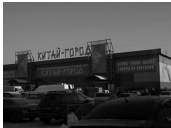
写真 4) 中国人市場「キタイ・ゴード」

まず、第一に、地域における小売市場・卸売市場における中国人市場の位置づけである。90年代初期、不足経済を引き継いだ地域消費市場において、特に、旧ソ連地域内での物流が寸断され、地域の消費財生産も滞り、必要とされる日常生活品が流通しなかったシベリアやロシア極東地域において、旧ソ連時代には国境を閉ざしていた中国からの消費財供給は、旧ソ連時代の消費財供給を代替するものであった。市場経済化が進展するにつれて、また、地域住民の所得が上昇するにつれて、地域の消費市場は中国から流入する消費財ばかりで構成されるのではなく、多様な流通経路をもつ製品で満たされるようになった。そ