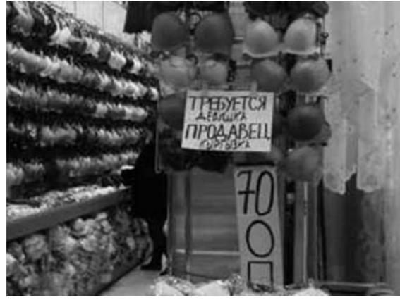
写真7) 「クルグズ人売り子求む」

クルグズスタンからの商人、労働者は、ビザなしでロシアに入国することができる。店子で働く従業員にとって、入国前に労働許可を取得しなければならない中国人労働者よりも遙かに入国が楽であるばかりか、労働許可や労働パテントを取得し合法（半合法）に働く条件をそろえるのが格段に容易である。私が市場を視察するなかで、多くのクルグズ人が働き、彼らの存在がエスニック・カフェを維持させ 9 、また、クルグズ商人の中国製品の質の高さとロシア語対応能力ゆえに、店先で「クルグズ人売り子求む」との求人広告が貼り出されているのを垣間見るなど（写真7）、中国製品を中心とした商業活動にクルグズ人が関わることで、彼らが持ち込む文化を市場に溶け込ませ、多文化的性格を市場に与えている。