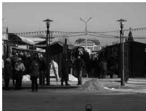
写真2) 営業を続ける中国人市場

中国人市場「上海」は、いくつかの市場を飲み込み、膨張していった経緯がある。その市場の区画はあいまいである。イルクーツクの中国人市場に詳しい現地の研究者と、地図上での中国人市場「上海」の特定を行う作業をしたが、もともとの「上海」は現在のショッピングモール「シャンハイ・シティ」周辺であり、いくつかの市場や周辺地域を飲み込んだ大「上海」は、ミチリャゼヴァ通から文化と憩いの中央公園に挟まれた非常に広大な領域を指す 5 。かつての中国人市場「上海」の敷地の一部には、2011年から開業した「シャンハイ・シティ」というショッピングモールがある（写真3）。ショッピングモール「シャンハイ・シティ」と通りを挟んだ向かい側にはパヴロ・チェトコフ広場という商業施設があり、その横には以前からの中国人市場が現在も営業している（写真2）。